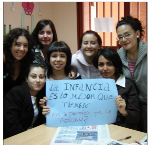
Imagen de los participantes de uno de los talleres de educación para el desarrollo sobre trabajo infantil impartidos en Castilla-La Mancha

PROYECTO SOLIDARIO lleva once años colaborando con los niños y niñas trabajadores latinoamericanos, a través de acciones de desarrollo que han beneficiado, hasta ahora, a más de 25.000 niños y niñas.